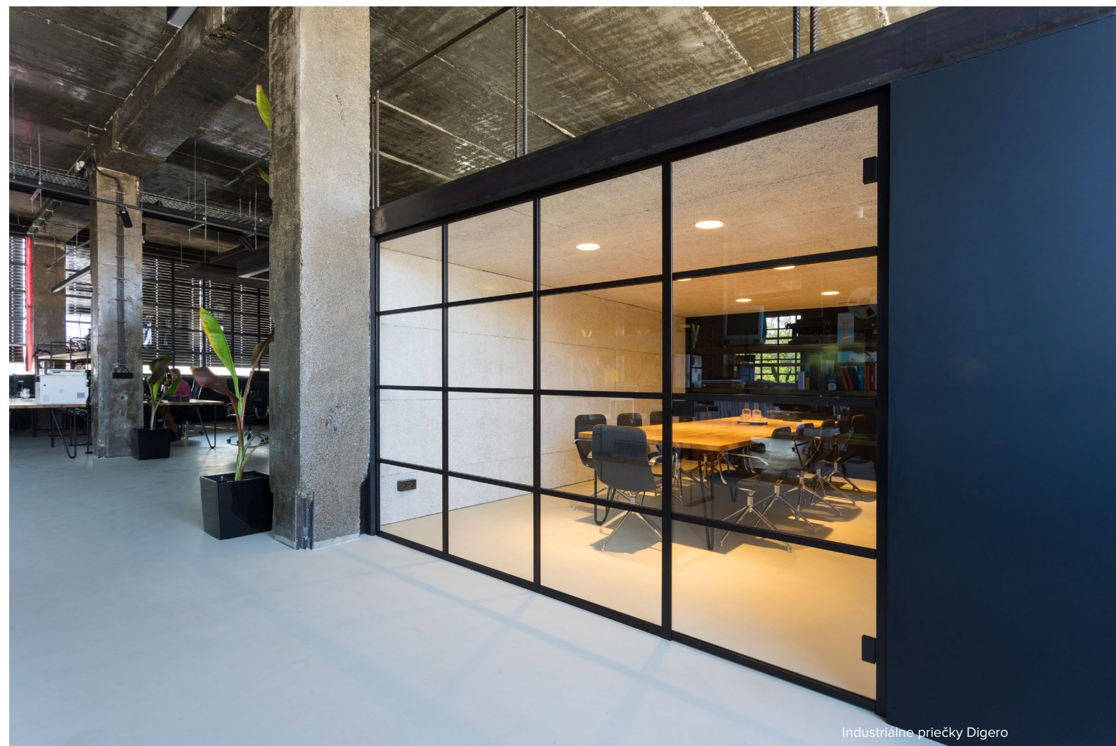
Industriálne priečky Digeró