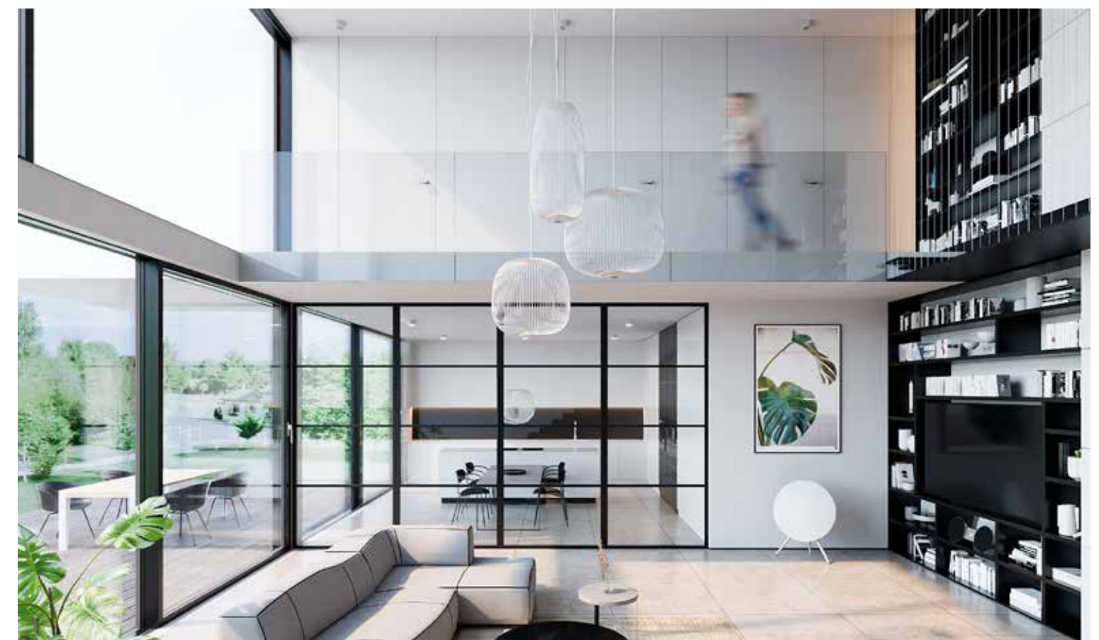
Rámová dělicí příčka DIGERO SWING pro industriální interiéry v dvoukřídlém provedení s hliníkovým rámem RAL 9005.