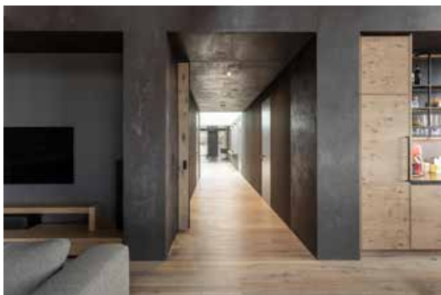
Realizace interiéru s posuvnými dveřmi až ke stropu, otevíravé dveře mají skrytou zárubeň FORTIUS 52.

Hlavním programem je výroba skrytých zárubní, které nabízíme v několika variantách pro různé tloušťky dveřních křidel.