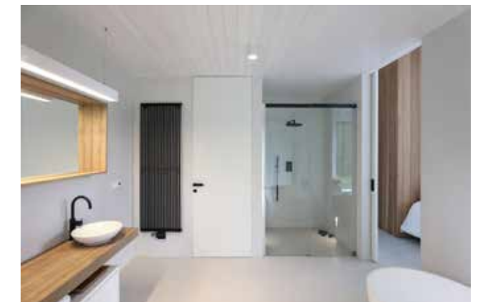
Bílá koupelna s dveřmi se zárubní FORTIUS 52 a matným povrchem v barvě RAL 9003.